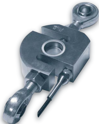
Capteur vendu séparément Load cell sold separately